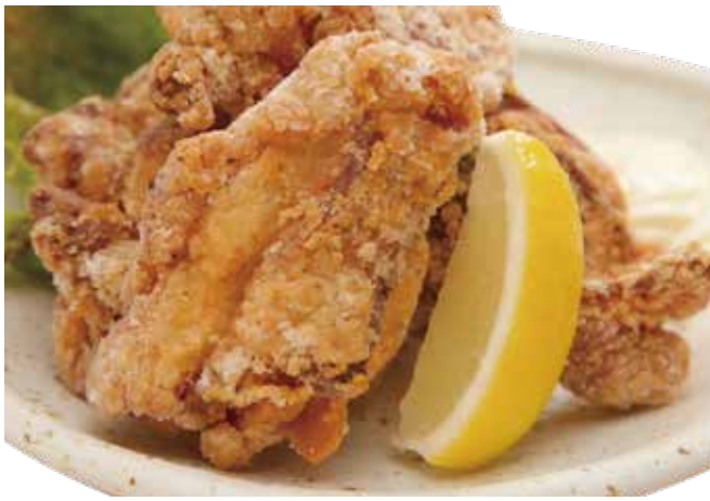
福よし特製ザンギ