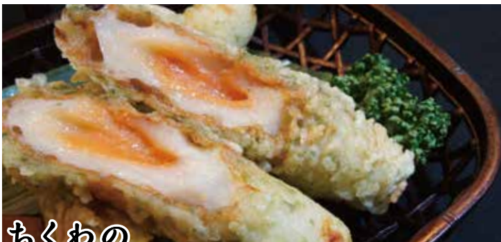
ちくわの 明太チーズ磯辺揚げ