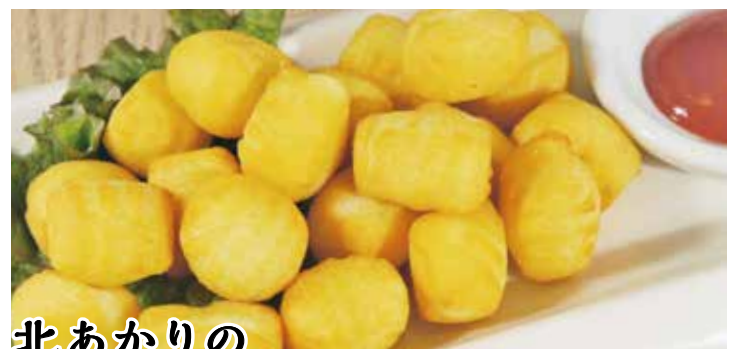
北あかりの 揚げニョッキ