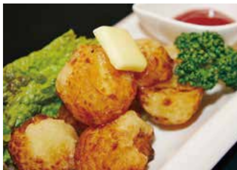
北あかりのポテトフライ