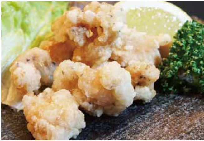
ホルモンの塩ザンギ