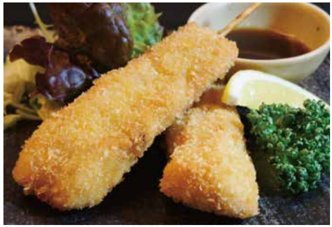
美唄のせい串カツ