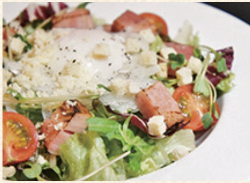
厚切りベーコンと温玉の シーザーサラダ