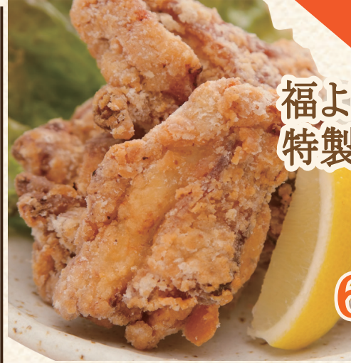
福よし 特製ザンギ