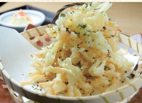
さきいかの天ぷら