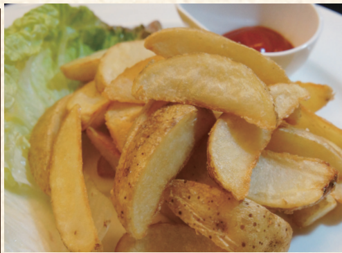
皮付きフライドポテト