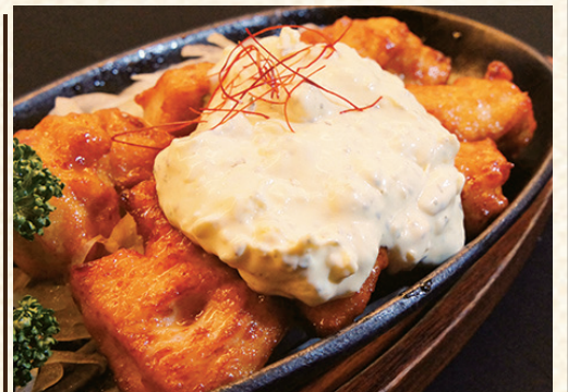
福よし特製チキン南蛮