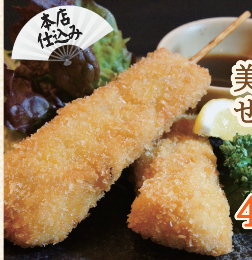
美唄の せい串カツ