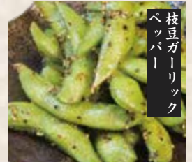
枝豆ガーリックペッパー