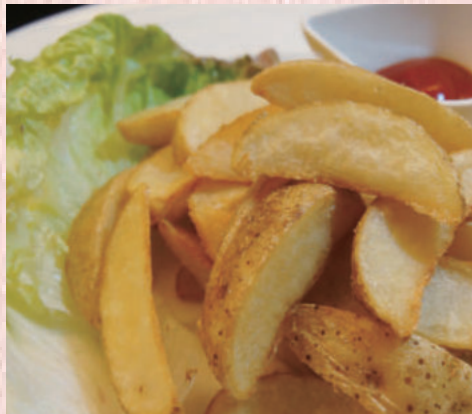
皮付きフライドポテト