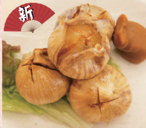
新 高山にんにく揚げ