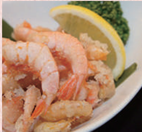
天然エビの唐揚げ