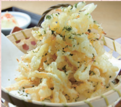
さきイカの天ぷら