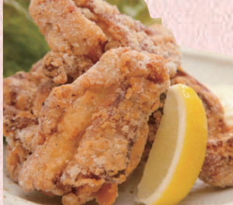
福よし特製ザンギ