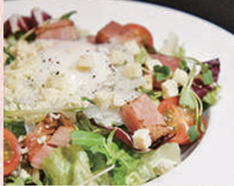
厚切りベーコンと温玉の シーザーサラダ