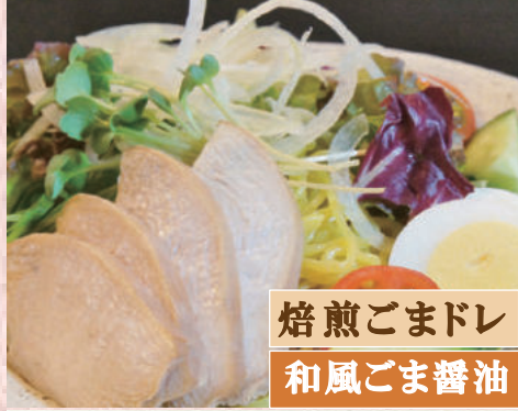
焙煎ごまドレ 和風ごま醤油