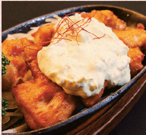
福よし特製チキン南蛮