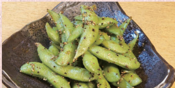
枝豆ガーリックペッパー焼き