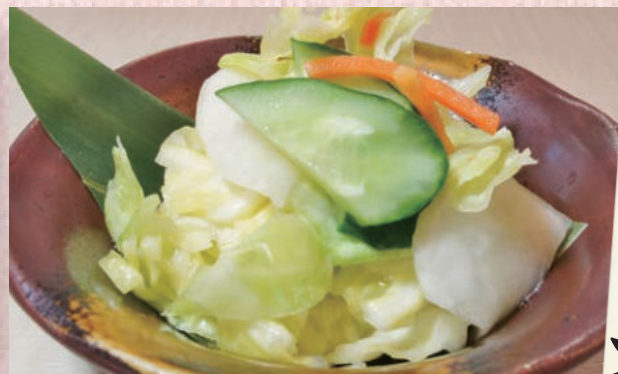
キャベツの浅漬け