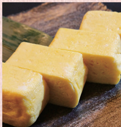
ふっくら出し巻玉子