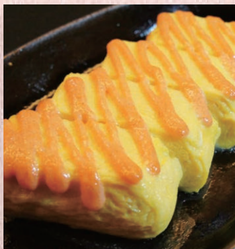
明太マヨ出し巻玉子