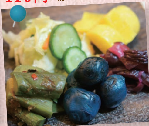
お新香の盛り合わせ