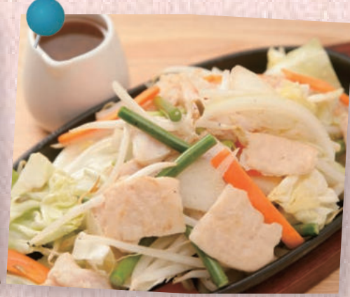
塩ホルモン鉄板焼き