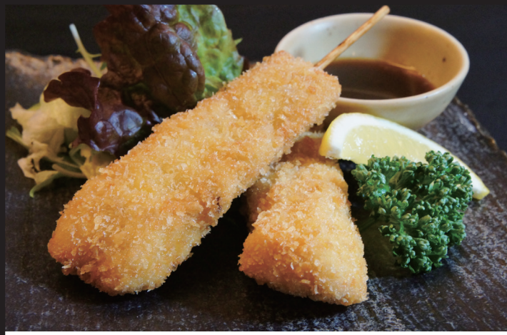
美唄のせい串カツ 【2本】 560円 (税抜) 616円 (税込)