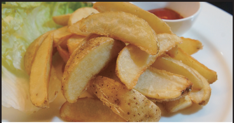
皮付きフライドポテト 430円 (税抜) 473円 (税込)