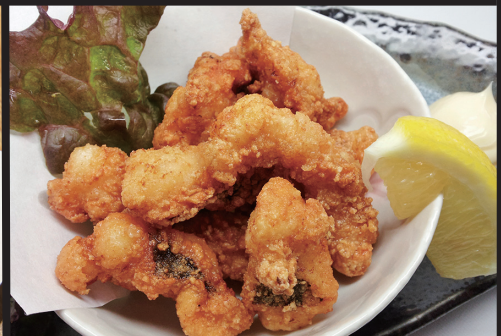
タコの柔らか揚げ 500円 (税抜) 550円 (税込)