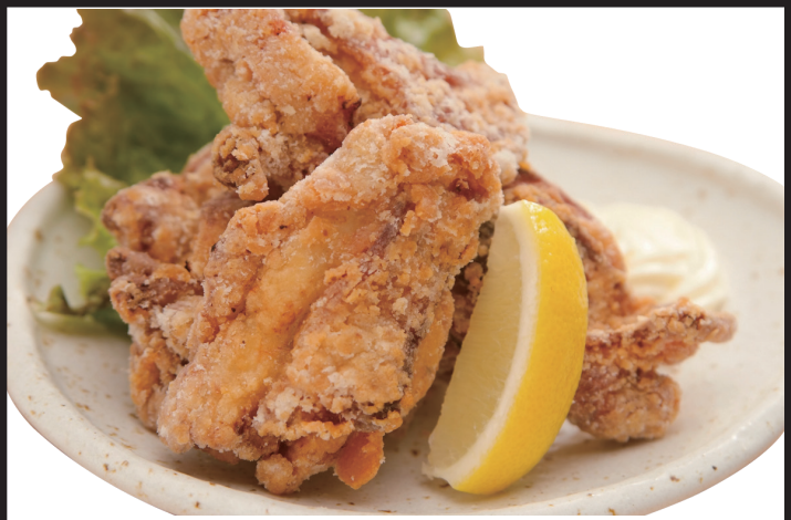
福よし特製ザンギ 650円 (税抜) 715円 (税込)