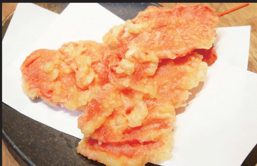
紅生姜の串揚げ 260円 (税抜) 286円 (税込)