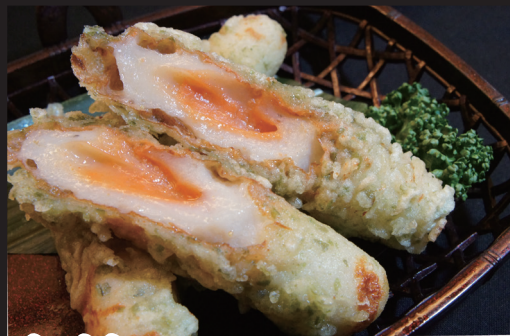
ちくわの 明太チーズ磯辺揚げ 580円 (税抜) 638円 (税込)