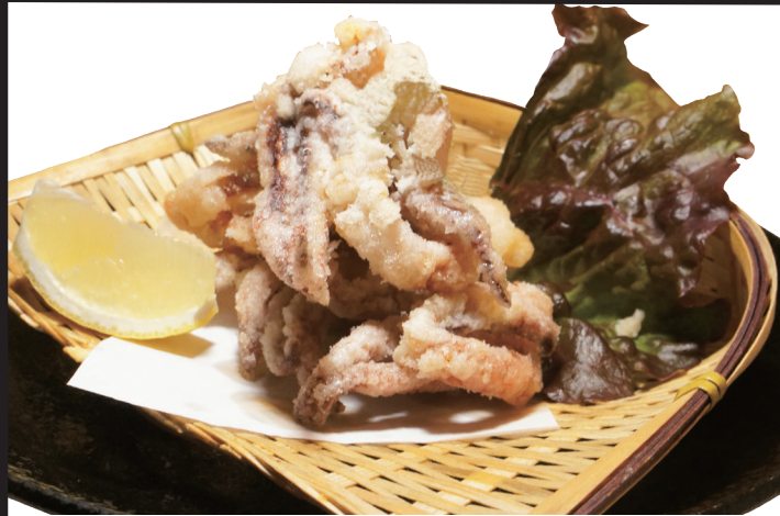
イカゲソ唐揚げ 480円 (税抜) 528円 (税込)