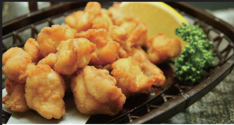
軟骨の唐揚げ 430円 (税抜) 473円 (税込)