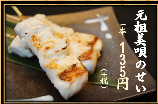
元祖美唄のせい 一本 135円 (+税)